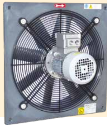
PLATE AXIAL FAN IN EXPLOSIVE ATMOSPHERE G OR D GROUP II CATEGORY 2 OR 3